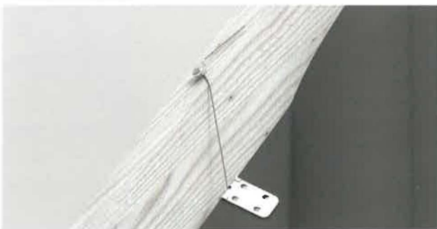
513 sichert geschnittene Pfanne am Grat