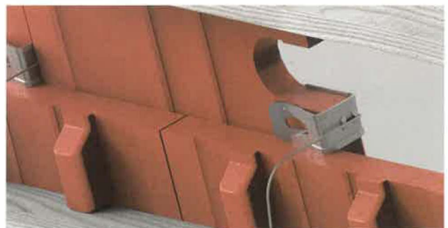
513 als „Nasenersatz“ bei fehlender Aufhängenase