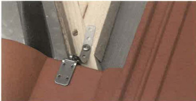
512 sichert geschnittene Pfanne in der Kehle